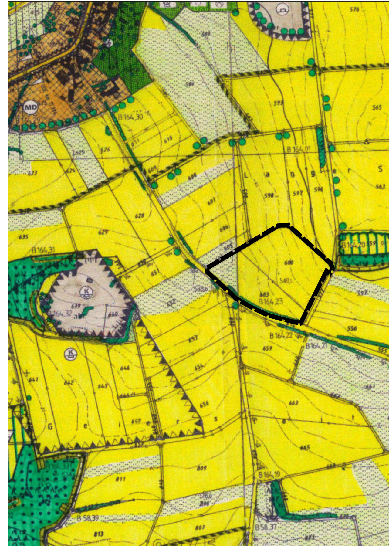
Kartengrundlage: Flächennutzungsplan (Scan)